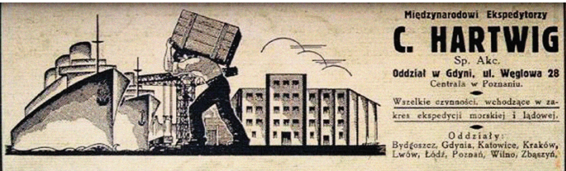
Archiwalna reklama C. Hartwig z lat 30ch

Trwają przygotowania do kolejnej edycji Forum Gospodarki Morskiej Gdynia, która odbędzie się 14 października 2016 roku. Jednym z wydarzeń towarzyszących tegorocznemu Forum jest konkurs filmowy. Już dziś zapraszamy filmowców do udziału w konkursie na scenariusz i realizację filmu krótkometrażowego promującego gospodarkę morską w Polsce, ze szczególnym uwzględnieniem województwa pomorskiego. Nagroda główna 15 000 zł (źródło: forum.gdynia.pl).