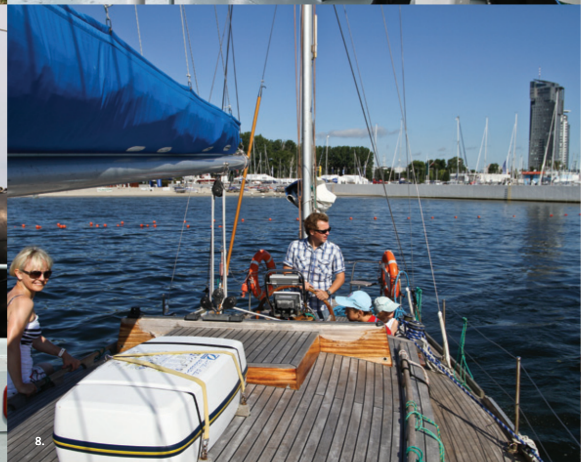
Fotografie: 1 - ORP Błyskawica fot. Jacek Debis, 2-4 - manewry Marynarki Wojennej, 5 - Placik Muzeum Marynarki Wojennej, 6 - zwiedzanie ORP Arctowski 7 - zwiedzanie ORP Błyskawica, 8 - rej. jachtów w ramach akcji „Prezenty Morskie Gdyni”, fot. 2-8 Przemysław Kozłowski